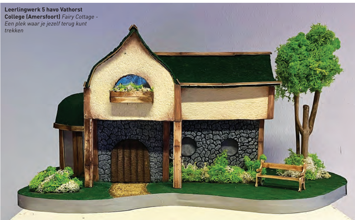
Leerlingwerk 5 havo Vathorst College (Amersfoort) Fairy Cottage - Een plek waar je jezelf terug kunt trekken